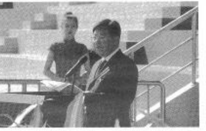
为丰富校园文化,该校还举办了“开学第一课”军事训练启动仪式。

本报讯(唐都融媒体记者 冯祥 通讯员 李学飞)10月13日上午,唐山职业技术学院2020级新生开学典礼暨军训动员大会在学校操场隆重举行。来自全国各地的4300多名新生相聚唐山职院,开启全新的逐梦之旅。