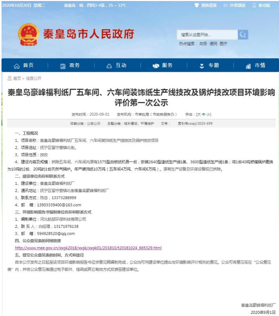
图 1 公众参与第一次网络公示图