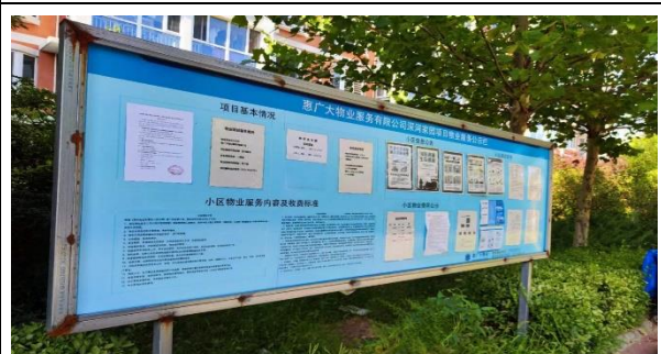
深河家园安置小区