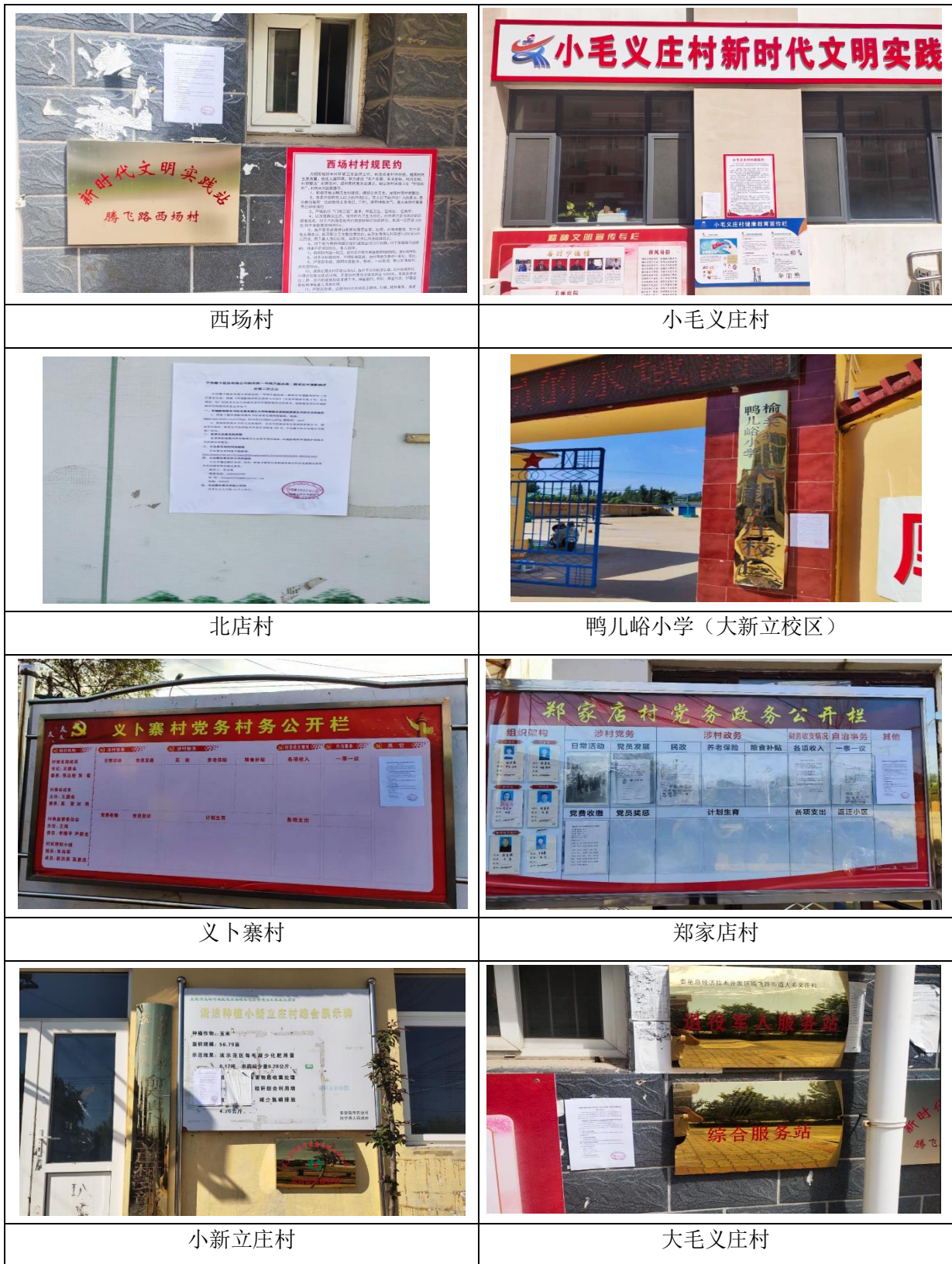
图 3.2-2 公示张贴情况图