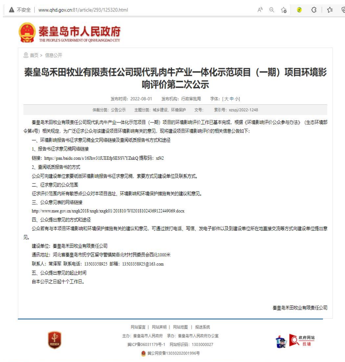
图2 征求意见稿网络公示截图

通过秦皇岛市人民政府网站进行公示，公示开始日期为2022年8月1日，公示周期为十个工作日。征求意见稿公示网络截图见图2，网址为： http://www.qhd.gov.cn:81/article/293/125320.html 。公示网站及时间可满足《环境影响评价公众参与办法》（生态环境部令 第4号）要求。