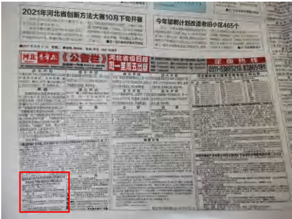
图 3-2 征求意见稿报纸公示照片（河北青年报，2021.8.17）