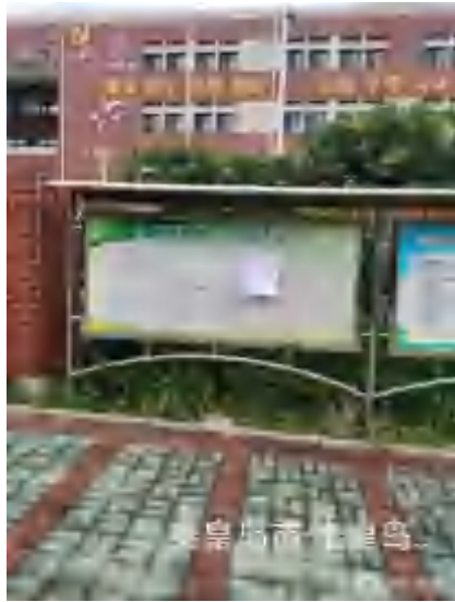
47、秦皇岛开发区第六小学