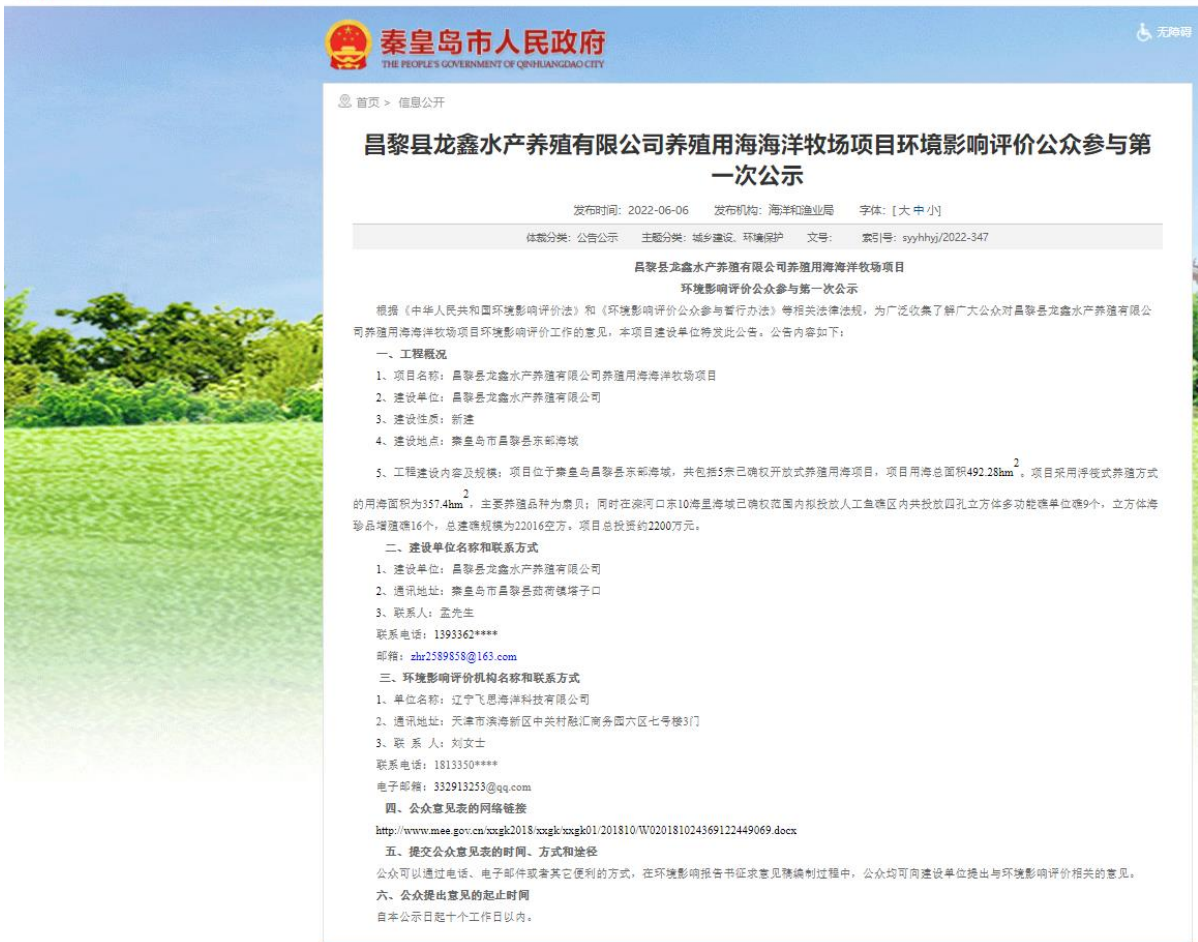
图 2.2-1 首次网络公开情况图