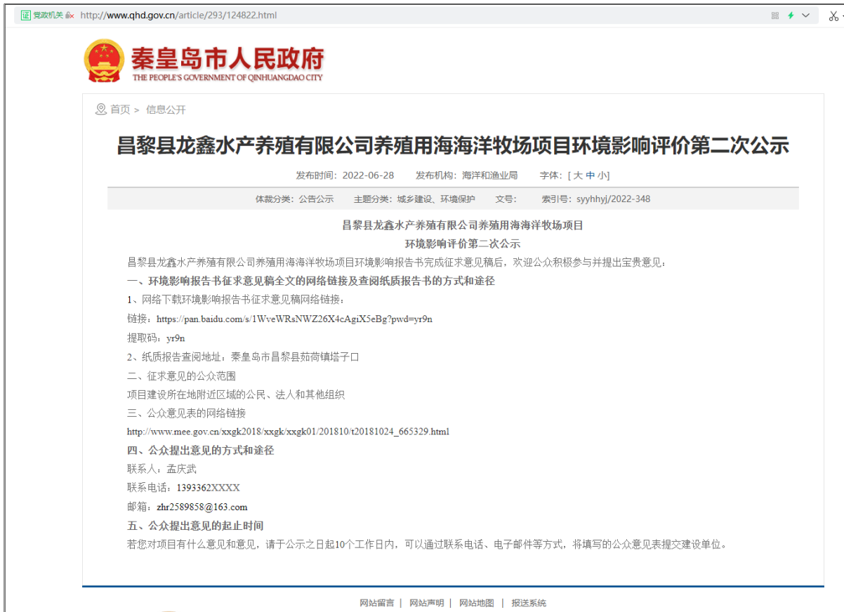
图 3.2-1 征求意见稿网络公开情况图