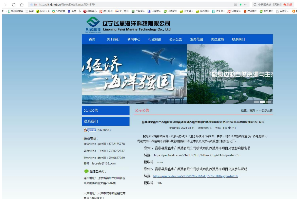
图 5-1 报批前信息公开截图