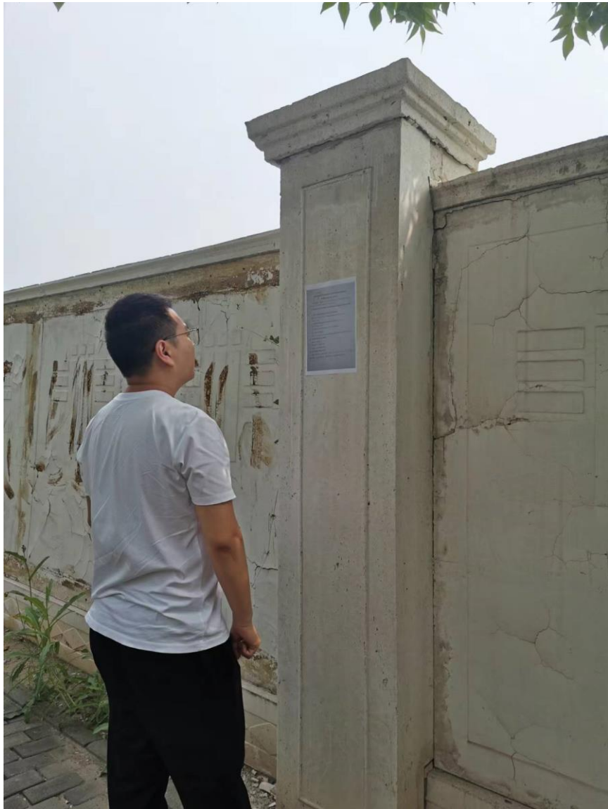
图 3.2-4 现场张贴照片