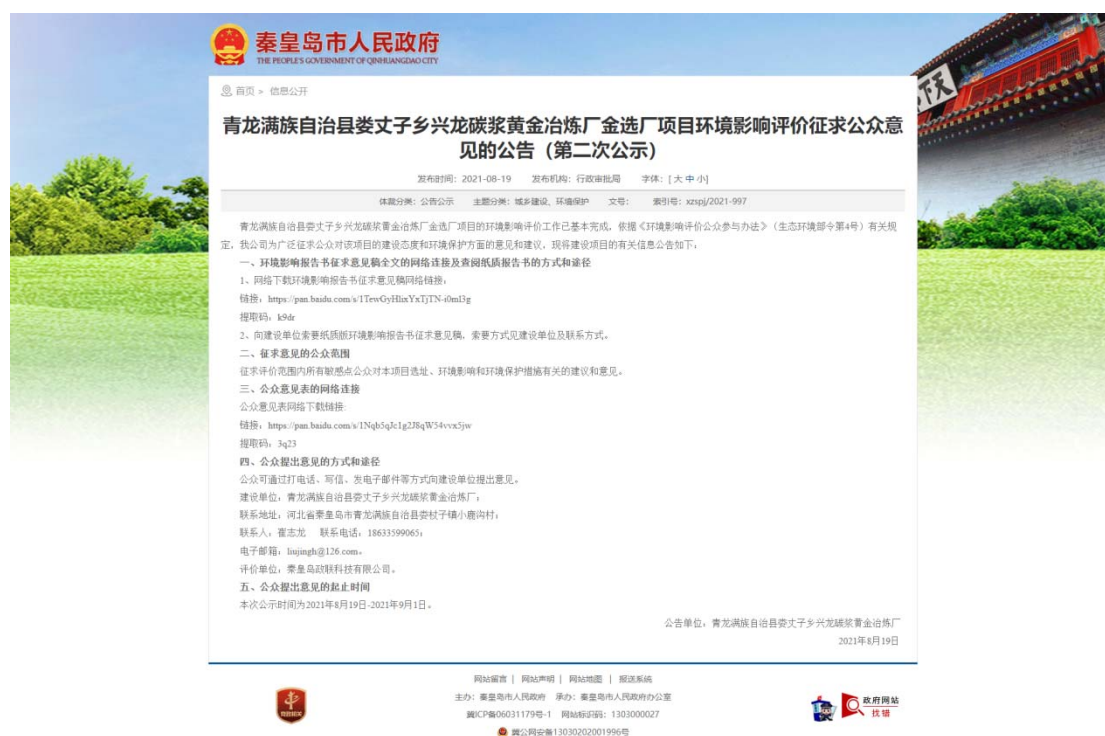
图 3-1 第二次网络公示图片

第二次网络公示日期为 2021 年 08 月 19 日至 2020 年 09 月 01 日，共 10 个工作日，公示网站为秦皇岛市人民政府网站，秦皇岛市人民政府网站 ( http://www.qhd.gov.cn/ ) 为官方网站，关注的公众较多，易于项目信息的传播。公示符合《环境影响评价公众参与办法》（生态环境部令第 4 号）第十条规定“通过网络平台公开，且持续公开期限不得少于 10 个工作日”要求。网络公示截图见图 3-1。