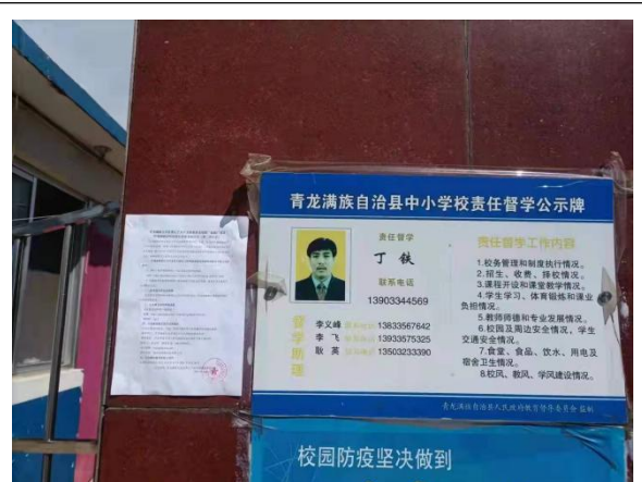
青龙满族自治县中小学