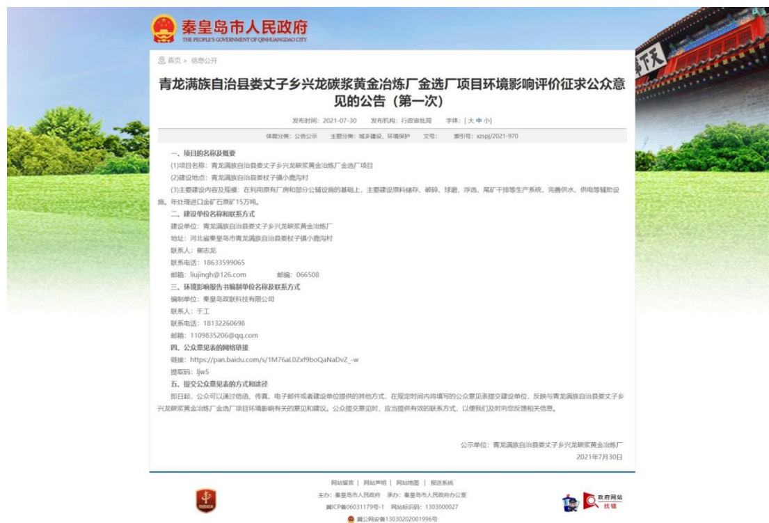
图 2-1 第一次网络公示图片

首次信息公示于2021年7月30日在秦皇岛市人民政府网站进行首次网上公示，秦皇岛市人民政府网站（ http://www.qhd.gov.cn/ ）为官方网站，关注的公众较多，易于项目信息的传播。网络公示截图见图2-1。